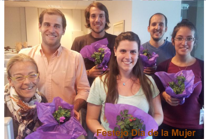
Festejo Día de la Mujer