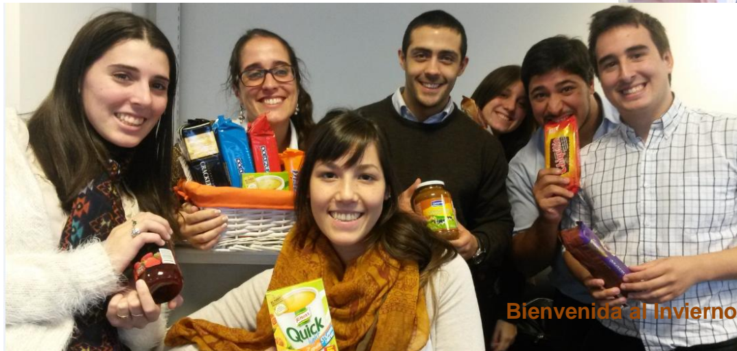
Bienvenida al Invierno