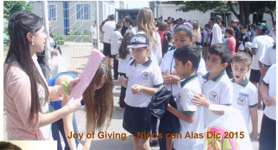
Joy of Giving – Niños con Alas Dic 2015