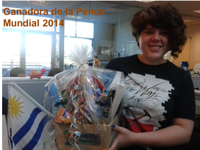
Ganadora de la Penca Mundial 2014